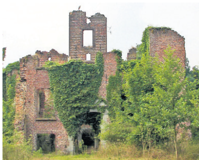
Kasteel Bleijenbeek 2009